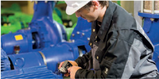
Einsatz des Messsystems an z.B. Motor, Pumpe, Lüfter