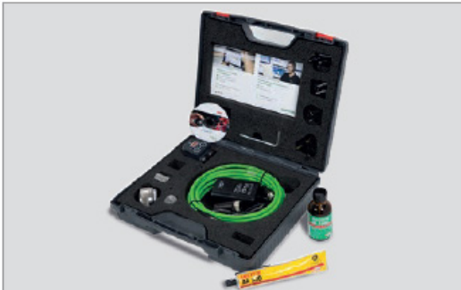
FAG SmartCheck Service-Kit